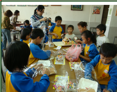
低年級聖誕薑餅屋 DIY