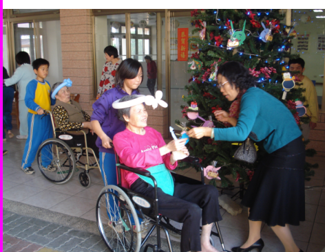
聖誕節感恩活動 東明護理之家