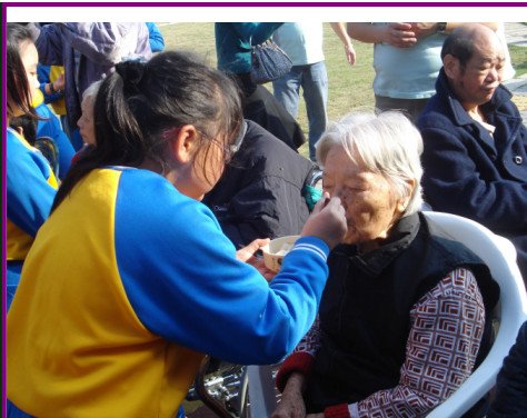
中高年級聖誕感恩活動