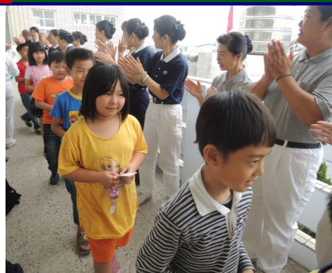
慈濟大愛媽媽孝親月活動

將這份美好感受和感恩行動寫下來，並付諸行動，這是相當重要的步驟，不僅可以當成日記本記錄心情，寫下來有加倍好心情的效果。記得將您心中的感恩即時表達，感恩要即時，快樂永隨行。