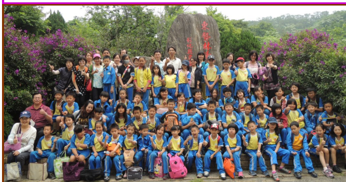
低碳彰化有 go 讚—東勢林場校外教學

我的家充滿了愛、甜蜜，全家人和樂融融的，希望我們全家人能夠永永遠遠快快樂樂地在一起。