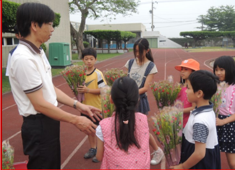
孝親月活動—校長頒發康乃馨