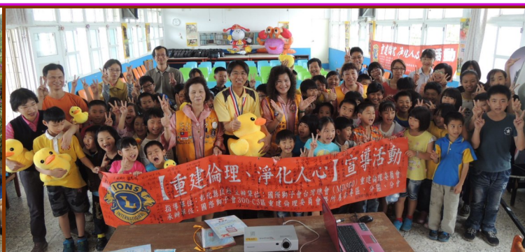
「重建倫理、淨化人心」宣導活動