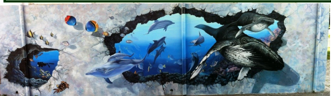
環境生態教育 3D 立體彩繪—海洋世界