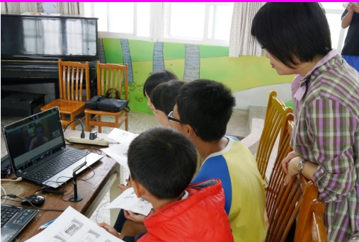
與外國大學生進行英語視訊教學