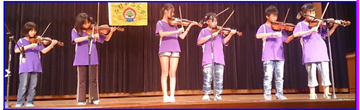
「國慶光臨之夜風華晚會」演奏小提琴

或許你我身邊正有些人獨自在面對生命中的難關，只要你我願意傾聽、伸出溫暖的雙手，或許就有機會弭平生命消逝的遺憾。 面對自殺，哪些事要避免？