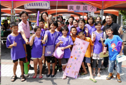
六甲參加儒林文化季義賣活動