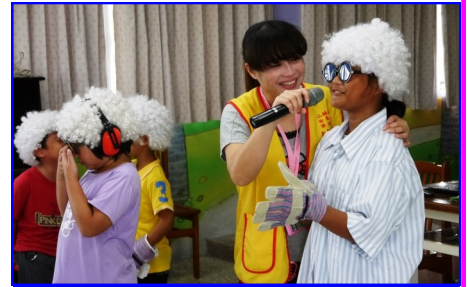
生命教育—生命老化體驗

「不要光說不練，有種你就去死啊！」，這種挑釁十分危險。萬一當事人真因如此而採取自殺行動，不僅令人後悔，也可能吃上官司。