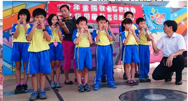
社區重陽敬老聯歡活動表演陶笛