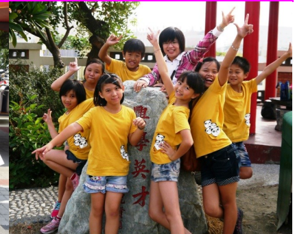
參加英語歌唱比賽